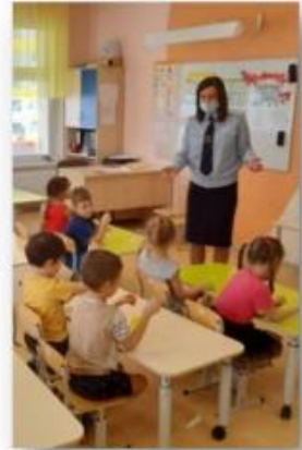
Беседа с инспектором о ПДД