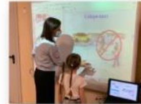
Проигрывание интерактивных игр

Из истории правил дорожного движения Современные дорожные знаки разнообразны, окрашены в яркие цвета и видны издали. Раньше каждое государство имело свои дорожные знаки. Теперь дорожные знаки одинаковы во всех странах.