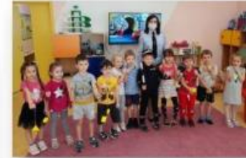
Изготовление светоотражающих брелков