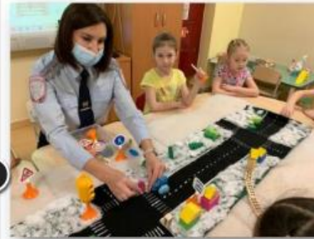
Изучение знаков дорожного движения