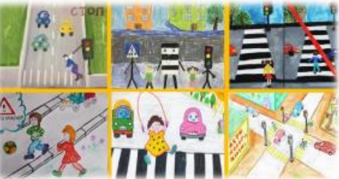
Конкурс свето возвращающих элементов для одежды